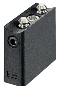
Endkappe End cap